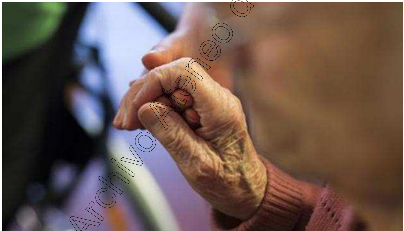
Imagen de archivo de una persona dependiente.

Lara Carrasco Publicada el 28/02/2019 a las 13:15 Actualizada el 28/02/2019 a las 14:11