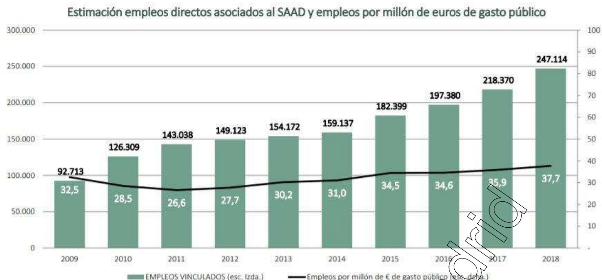
Gráfico 36. – Elaboración propia. Estimación basada en datos SISAAD y en las ratios oficiales medias de personal asignado a los distintos servicios (Resolución Ministerial en BOE nº 303, de 17 de diciembre de 2008). Las ratios contempladas han sido: Teleasistencia = 0,01; Ayuda a domicilio = 0,33; Centro de Día = 0,25; Residencia = 0,50; Prestación económica Vinculada = 0,4; Prestación económica para Asistente Personal = 1.

La situación de la dependencia, aunque negativa en general, encuentra diferencias en las distintas comunidades autónomas. Así, hay algunas que tienen atención plena, como Castilla y León y Ceuta y Melilla; otras que han progresado positivamente en los dos últimos años, como Aragón, Baleares, Castilla-La Mancha, Comunidad Valenciana, Extremadura, Galicia, Madrid y Murcia; y otras en las que se observa un estancamiento que llega a ser "preocupante", como Cataluña, Andalucía y Canarias. "Dos comunidades, Andalucía y Cataluña, representan el 60% de la lista de desatención ", un limbo que alcanza al 32,6% de las personas dependientes catalanas.